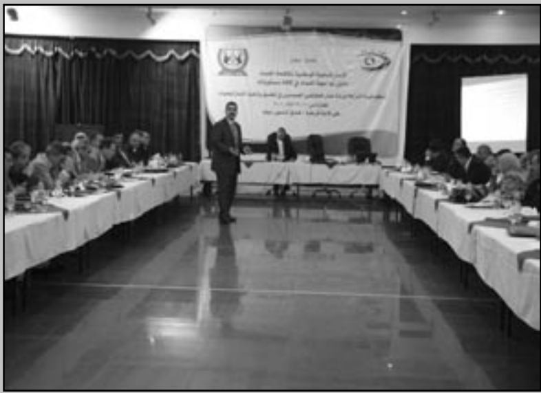
جانب من نشاطات الهيئة

رسم بياني يوضح مقدار النسب المئوية التراكمية لدافعي الرشوة لغاية آذار ٢٠١٠ في عموم العراق