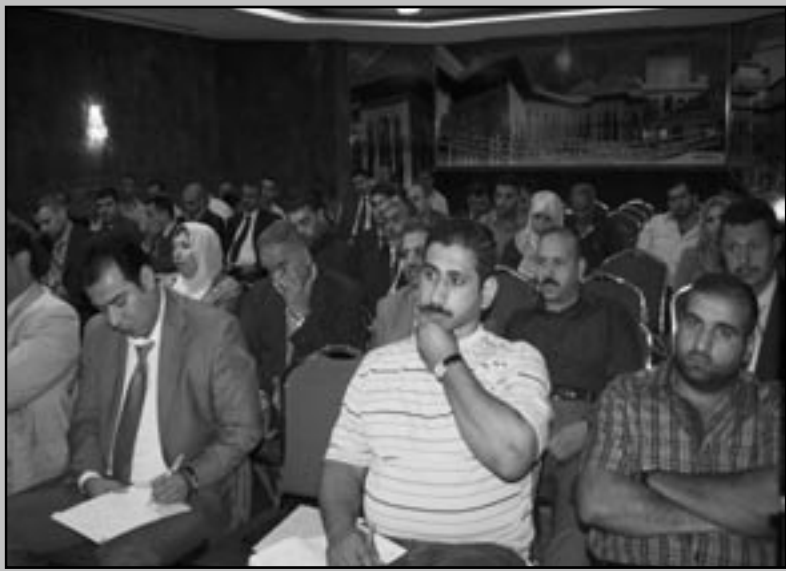
جانب من نشاطات الهيئة

الدوائر والوزرات المختلفة. ٦.قامت الهيئة بزيارات ميدانية من اجل نشر ثقافة النزاهة ووبواق (١٦) زيارة لمدارس ابتدائية ومتوسطة وثانوية و (٩) زيارات لمنظمات المجتمع المدني. ٧.الاستمرار بعرض نشاطات الهيئة في كافة الميادين وعلى الموقع الالكتروني ففي المجال التحقيقي تم نشر اسماء المزورين لوثائقهم الدراسية والبالغ عددهم (٢٠٣٩) مزوراً ووباق (٧٠٨) موظفا و(١٠٤٥) طالبا و ( ٢٨٦ ) مرشحا في انتخابات مجالس المحافظات وكذلك نشر اسماء المزورين من الوظيفة والبالغ عددهم (٥٩٥) موظفا اضافة الى نشر (٧٢) بحثاً علمياً في مختلف الاختصاصات. ٨.التعاون مع منظمات المجتمع المدني للتنسيق والتعاون في مجال اقامة النشاطات المشتركة حيث عقد اجتماعين ودورتين تريوتين في هذا المجال.