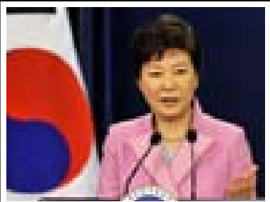
العيسن/ وكالات بدأت المحكمة الدستورية الكورية الجنوبية، أولى جلساتها للنظر بمذكرة إقالة رئيسة كوريا الجنوبية (بارك كون هيه)، حيث صوت البرلمان على عزلها على خلفية

التورط في فضيحة فساد واستغلال النفوذ، والتي تم على خلفيتها تسليم سلطاتها التنفيذية إلى رئيس الوزراء (هوانج كيو-هن)، لأنه يعد قائما بأعمال الرئيس. ويجري الآن النظر من قبل المحكمة الدستورية، في قضية الاتهام بتقصير وتواطئ الرئيسة الكورية في فضيحة الفساد، مع صديقتها (شون سيل)، ويحضر الجلسة الأولى، محامي لجنة المساءلة في البرلمان الكوري، فيما التقطت صورة لحامي الرئيسة الكورية وهو يصلي داخل قاعة