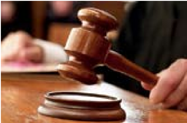
العيسن/ وكالات بدأت في هونج كونج محاكمة الرئيس السابق دونالد تسانج، حيث يواجه اتهامات فساد.

وذكرت مصادر صحفية أن تسانج (٧٢ عاما) الذي شغل منصب الرئيس التنفيذي لهونج كونج خلال المدة من ٢٠٠٥ حتى ٢٠١٢ يواجه ثلاثة اتهامات، بينها تهمةان بسوء السلوك أثناء تولي وظيفة عامة وتهمة ثلاثة بقبوله رشوة أثناء عمله كرئيس تنفيذي، فيما ينفي دونالد تسانج جميع الاتهامات المنسوبة إليه. كما يتهم تسانج بعدم الكشف عن تعاملاته مع رجل الأعمال بيل وونغ تشو باو، وهو أحد كبار المساهمين في إذاعة (ويف ميديا) السابقة، التي أعيدت تسميتها حاليا بـ(ديجيتال بروكاستينج كورب). ولم يكشف تسانج عن خطط لاستئجار شقة فاخرة بسعر أقل من السعر الحقيقي في السوق من وونغ، وفي المقابل وافق رسميا على منح رخصة بث رقمي لشركة وونغ.